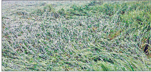
यमुनानगर। नीचले इलाकों में बारिश व हवा चलने से खेतों में बिछी हुई गेहूं की फसल व बारिश के बीच में से गुजरते हुए वाहन।

खेतों में लहलहा रही गेहूं और सरसों की फसल पर शनिवार को तेज हवा के साथ कहीं हल्की तो कहीं तेज बारिश ने कहर बरपा दिया है। हवा के साथ बारिश होने से अधिकांश खेतों में अगती गेहूं की फसल नीचे बिछ गई है। वहीं, सरसों की फसल को भी नुकसान हुआ है। किसानों ने खेतों में बिछी गेहूं की फसल में नुकसान होने की संभावना जताई है। वहीं, बारिश होने से मौसम में टंडक बढ़ गई और तापमान में गिरावट दर्ज की गई। शनिवार तड़के दो बजे अचानक आसमान में बादल गर्जन लगे और बिजली कड़कने लगी। कुछ देर के बाद तेज हवा के साथ बारिश शुरू हो गई और करीब एक-एक कर दो घंटे होते रही। इसके बाद सुबह सात बजे के करीब फिर से बारिश शुरू हो गई और तेज हवा चलने से कई स्थानों पर खेतों में खड़ी गेहूं व